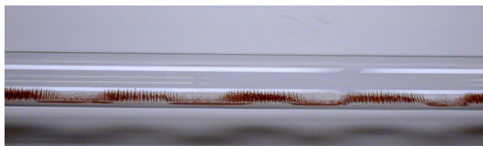
شکل ۱: لوله کنت وسیله‌ای برای تولید امواج صوتی ایستاده

لوله کنت (شکل ۱) و لوله رابن (شکل ۲)، دو وسیله که با استفاده از آنها می‌توان امواج صوتی ایستاده تولید کرد. لوله کنت به نام آگوست کنت ۱ ، و لوله رابن به نام هنریش رابن ۲ که هر دو فیزیکدان آلمانی بودند نام‌گذاری شده است.