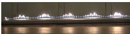
شکل ۲: لوله رابن وسیله‌ای برای تولید امواج صوتی ایستاده

برای تولید امواج صوتی با بسامد متغیر از یک بلندگو که به نوسان‌ساز (اسیلاتور) وصل می‌شود، استفاده می‌کنیم. برای تشکیل نقش گره و شکم امواج ایستاده در لوله کنت از گرد چوب استفاده می‌شود و در لوله رابن به علت تغییر فشار گاز در محل گره و شکم نقش امواج ایستاده با شعله‌های آتش تشکیل می‌شود. با استفاده از نقش گره و شکم امواج ایستاده، می‌توان طول موج را به دست آورد. سپس برای بسامد معلوم، سرعت صوت را تعیین کرد.